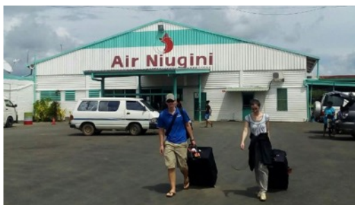
Madang-i reptér és a "limbó-hintó" amivel a táborhoz érkeztünk (ezzel szállítják csoportunkat a legtöbbet)

A fenti esemény mellett voltak más izgalmas helyzetek is, amik csak abban segítettek, hogy újra meg újra lássuk az Úr gondviselését. A reptéren várt már ránk az Óceániai Orientációs Képzés (POC) igazgatója, aki elvitt minket, három másik családdal együtt, a POC táborba. A hazánkban lévő hegyi utakhoz (drum forestier) hasonló, kb. 1 órás, rázós út vezet a városból a táborhoz, mely egy kisebb hegy szirtjén helyezkedik el. Egyre gyönyörűbb táj tárul elének ahogy a tábor felé haladunk és a tábornál a kilátás lélegzetelállító. Egyszerre láthatjuk a számunkra dzsungelnek tűnő hegyoldalt, völgyet, (mely, mint kiderült, az emberek kertje is, és sok ház húzódik meg közöttük), a távolban az óceánt s az apró szigeteket, illetve derült időben egy működő vulkánt is, ami egy különálló szigeten van.