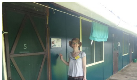
Szobánk, kívülről és belülről