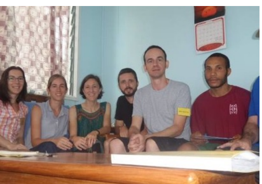
Jobb oldalt - Tok Pisin tanárunk

Ezen a képzésen (POC), rajtunk kívül még 11 család és 3 egyedülálló vesz részt, többnyire az Egyesült Államokból és még egy család Németországból. Érdekes, hogy legalább annyi gyermek van mint felnőtt. Hálát adunk az Úrnak, hogy erőt és bátorságot adott nekik, hogy ezt a hitlépést megtegyék és ide jöjjenek.