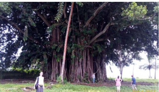
Egy óriási fa minek furcsa gyökerei közt elférne több mint 20 ember